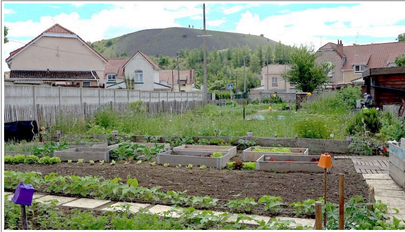
Cité Darcy, Hénil-Beaumont

Compagnie TDC 15/17 rue du Prieuré 59800 Lille